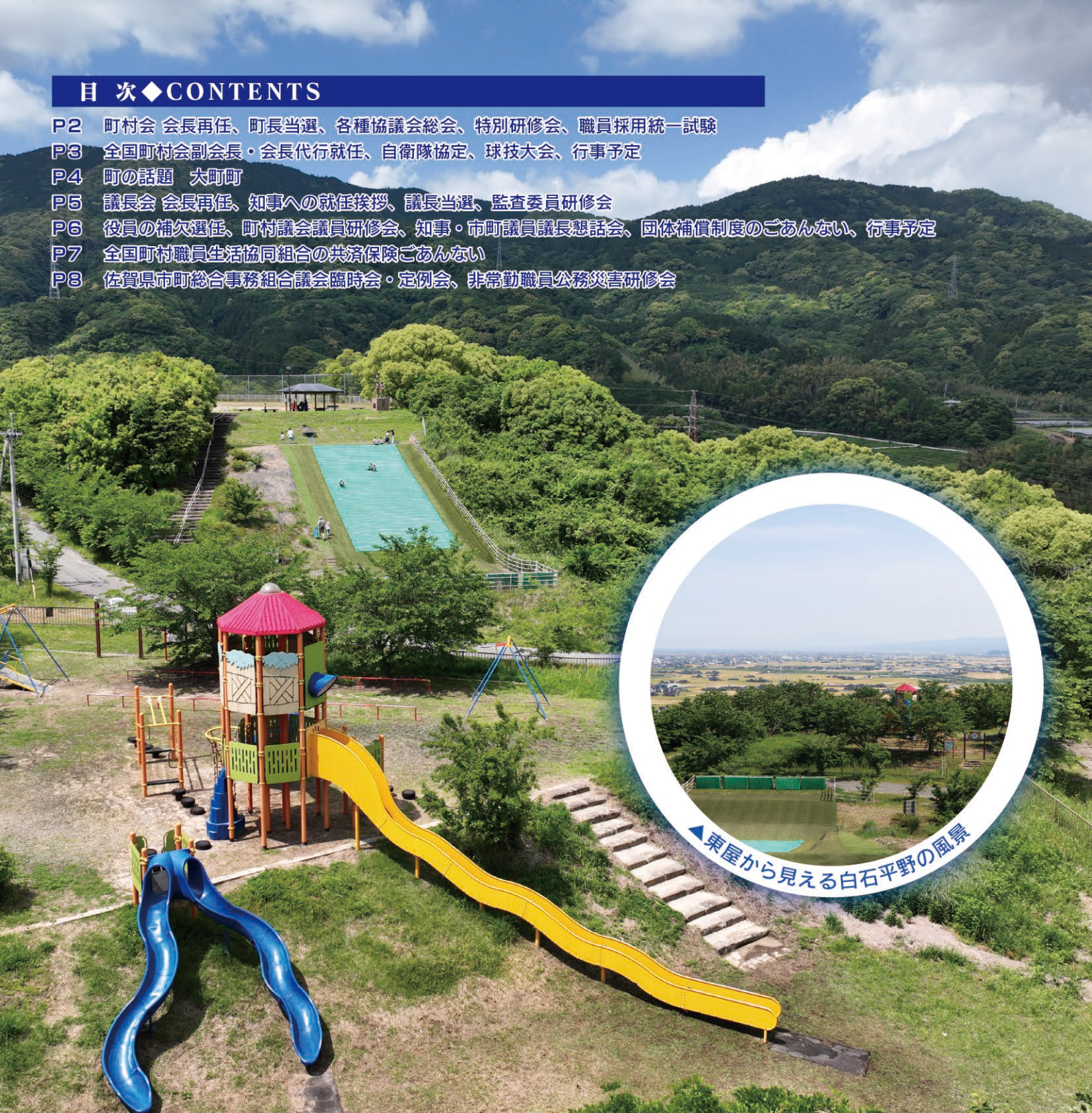
東屋から見える白石平野の風景