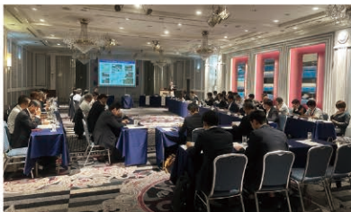
砂防行政に係る講演会