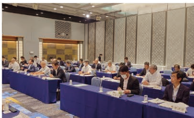
佐賀県道路愛護協会総会

令和5年7月31日(月)、ホテルニューオータニ佐賀(佐賀市)にて、道路整備促進期成同盟会佐賀県地方連絡協議会、佐賀県道路愛護協会、佐賀県治水砂防・防災協会の総会を県内各市町長ほか多数の来賓及び市町職員の参集のもと開催した。 なお、総会終了後、県主催による砂防行政に係る講演会等が開催された。