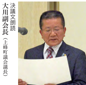
決議文朗読 大川副会長(上峰町議会議長)