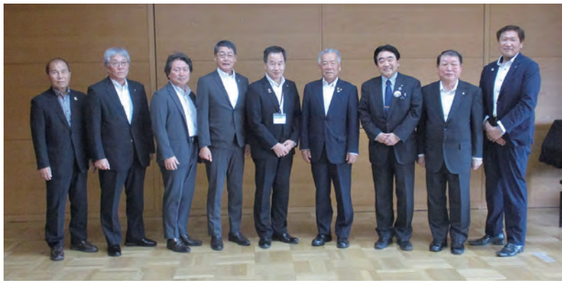
熊取町にて藤原敏司熊取町長との集合写真

10月2日(木)には、大阪府泉南郡熊取町の熊取町図書館にて、妊娠から出産期、そして若者になるまで切れ目のない支援を行う「子育て支援事業(ホームスタート)」及び住民の意見を聞きながら住民と協力して図書館を作っていく「住民参加の図書館づくり」について説明を受けた。各町長から多くの質問がなされ、活発な意見交換が行われた。